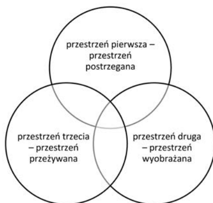
Rys. 1. Model trialektyki przestrzeni