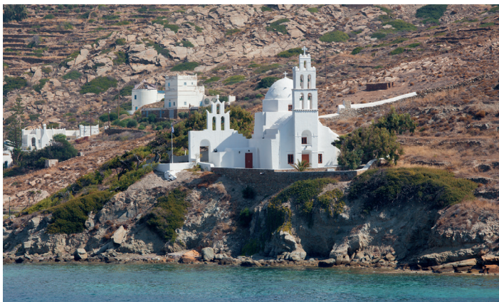
▲ Kościół Agia Irini

im. Odysseasa Elytisa , mogący pomieścić ponad tysiąc widzów. Rozpociera się z niego wspaniały widok na zatokę Milopotas i Morze Egejskie. Każdego lata odbywają się tu liczne koncerty i występy teatralne w ramach Festiwalu Homerowskiego.