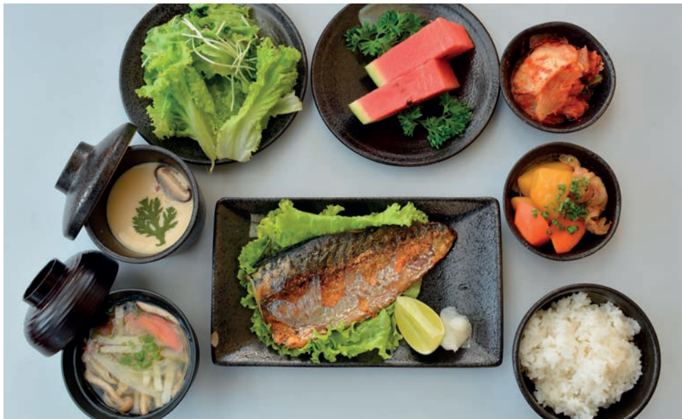
RYSUNEK W.1. Seki saba — sposób podania