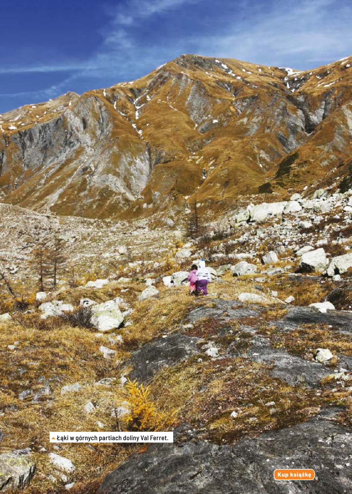
▲ Łąki w górnych partiach doliny Val Ferret.