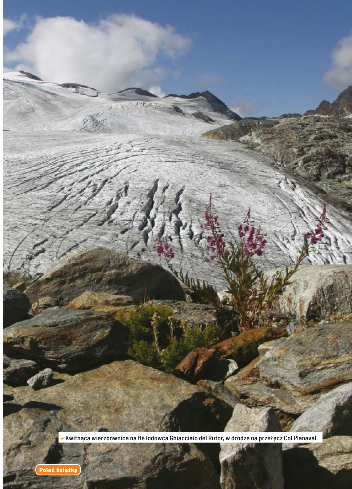
▲ Kwitnąca wierzbowica na tle lodowca Ghiacciaio del Rutor, w drodze na przełęcz Col Planaval.