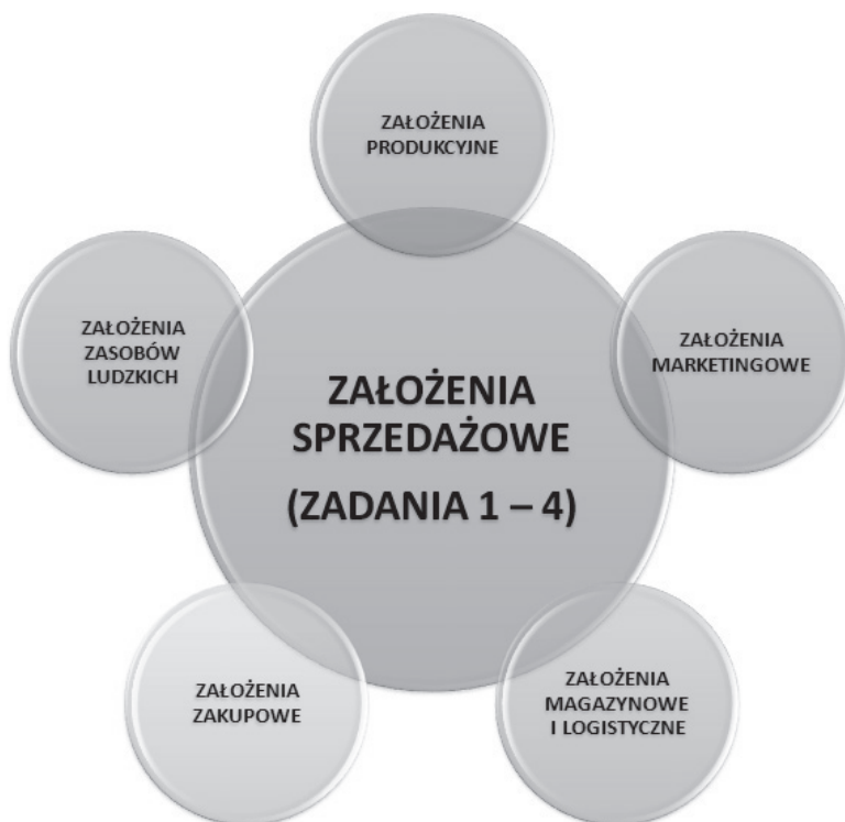
Rysunek 7.2. Zależności poszczególnych elementów składowych strategii

planowaną sprzedaż w nowej branży z podziałem na wyroby i klientów, a w wyniku prac poszczególnych innych działów nad założeniami strategii otrzyma część kosztową niezbędną do określenia rentowności wyrobów czy klientów.