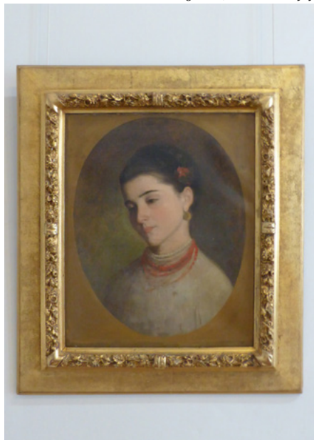
Nicolae Grigorescu, Głowa dziewczyny