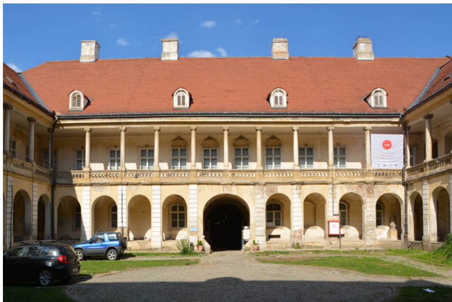
Pałac Bánffy, dziedziniec, skrzydło wschodnie

Pomimo że budynek jest późnobarokowy, to dziedziniec wewnętrzny z krużgankami nawiązuje do renesansu.