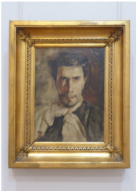
Ștefan Luchian, Autoportret, 1908