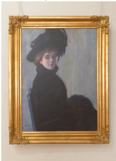
Ferenc Ács, Portret kobiety, 1896