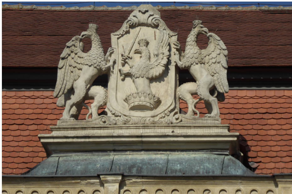
Kartusz herbowy rodziny Bánffy

Fasadę wieńczą posągi: Marsa, Minerwy, Apolla, Diany, Herkulesa, Perseusza i herb rodziny Bánffy.