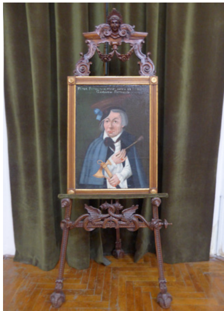
István Szathmári Gáti, Autoportret, XIX w.

Zgromadzono liczne dzieła znanych artystów węgierskich i rumuńskich, głównie z XIX i XX w.