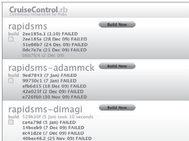
Rysunek 3.2. Integracja gałęzi

Można zdać się na prostszy model pozwalający na osiągnięcie niektórych korzyści ciągłej integracji. W tym modelu tworzysz kompilację CI dla każdego repozytorium. Po każdej zmianie próbujesz scalić zmiany z oznaczonego repozytorium pierwotnego i przeprowadzić kompilację. Rysunek 3.2 przedstawia CruiseControl.rb kompilujący główne repozytorium projektu Rapidsms oraz jego dwóch odgałęzień.