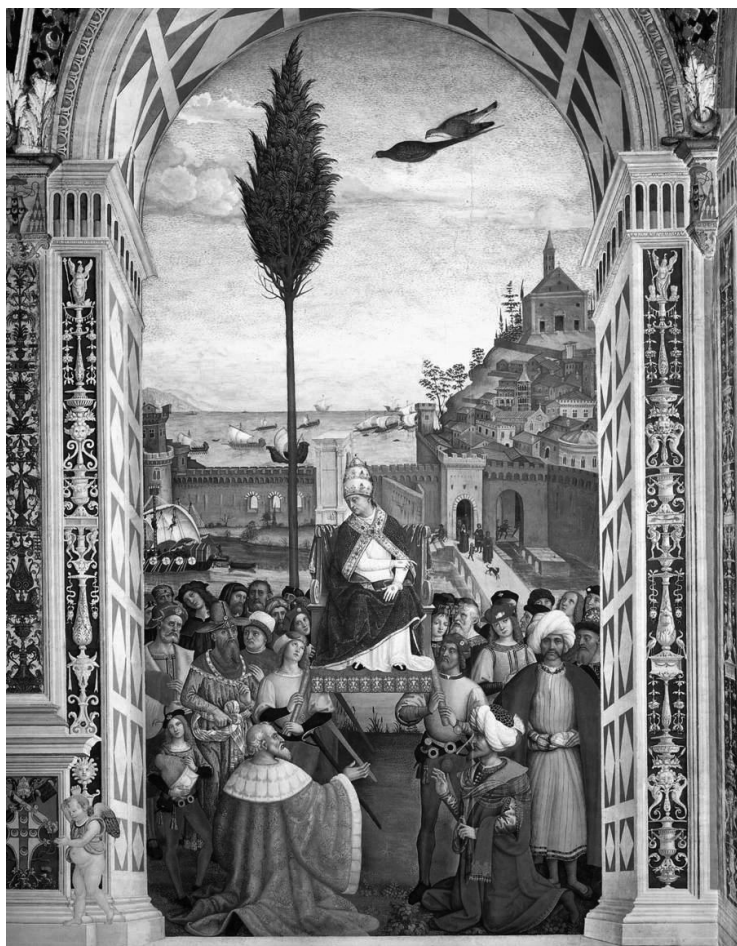
Ilustracja 5. Piccolomini jako papież Pius II (w Ankonie). Pinturicchio, fresk w bibliotece katedralnej w Sienie.