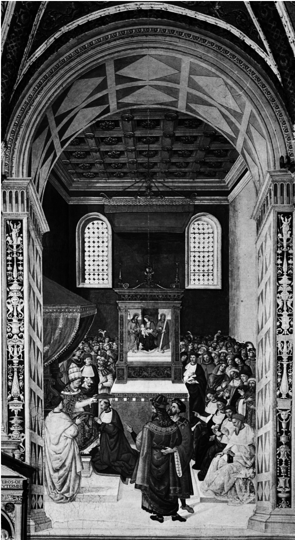
Ilustracja 2. Piccolomini otrzymuje kapelusz kardynalski. Pinturicchio, fresk w bibliotece katedralnej w Sienie.