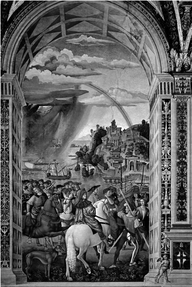
Ilustracja 1. Wjazd Piccolominiego do Bazylei. Pinturicchio, fresk w bibliotece katedralnej w Sienie.