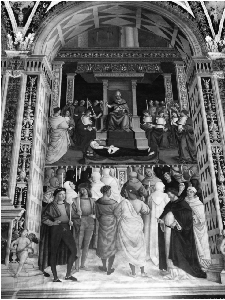
Ilustracja 4. Piccolomini (pod baldachimem) kanonizuje Katarzynę ze Sieny. Pinturicchio, fresk w bibliotece katedralnej w Sienie.