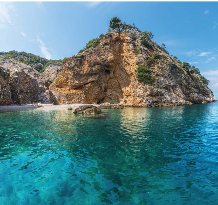
▲ Skalistą zatoczką na Cresie