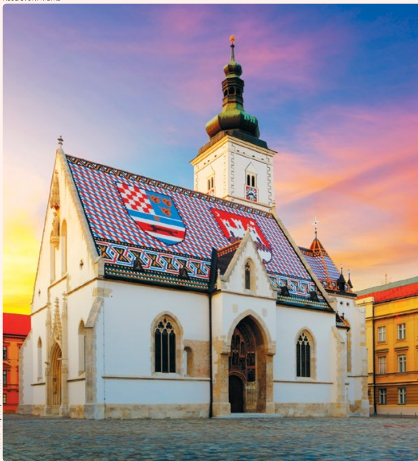
Kościół św. Marka

Stolica i zarazem największe miasto Chorwacji. Do najciekawszych obiektów należą: katedra Wniebowzięcia NMP, kościół św. Marka, kościół św. Katarzyny, wieża Lotrščak i XIII-wieczna Kamienna Brama. Więcej zob. s. 95.