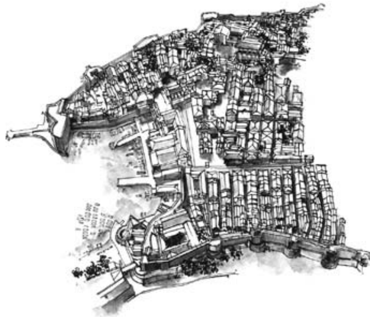
► Panorama Starego Miasta, rys. W. Kwiecień-Janikowski

Wznosi się on na wystającej z morza skale o wysokości 37 m (wstęp w ramach biletu pozwalającego na zwiedzanie murów miejskich – ☉ codz. 8.00–19.00; dorośli 50 HRK, dzieci 20 HRK). Z daleka fort wygląda imponująco – samotna, potężna twierdza na skalistym półwyspie. Budowla owiana jest tajemnicą i krążą o niej liczne legendy. Jedna z nich odnosi się do tradycyjnych zatargów mieszkańców Dubrownika z Wenecjanami i mówi o tym, jak twierdza powstała. Podobno Wenecjanie postanowili wybudować w tym miejscu fortecę, która miałaby pomóc w utrzymywaniu kontroli