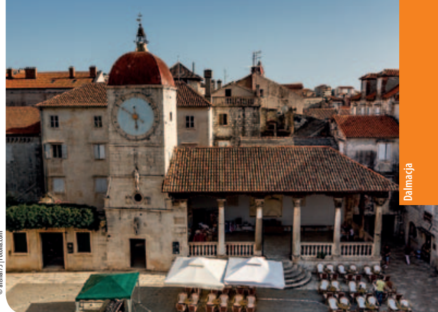
Wieża zegarowa w Trogirze