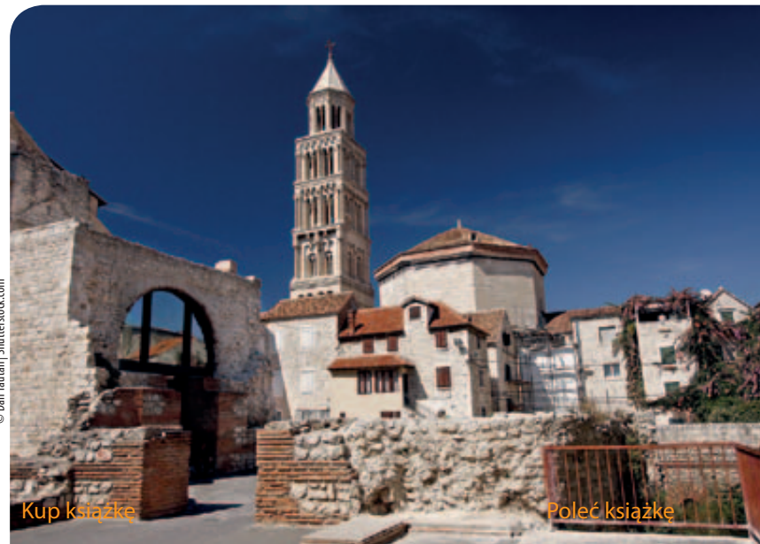
Split, katedra św. Dujama