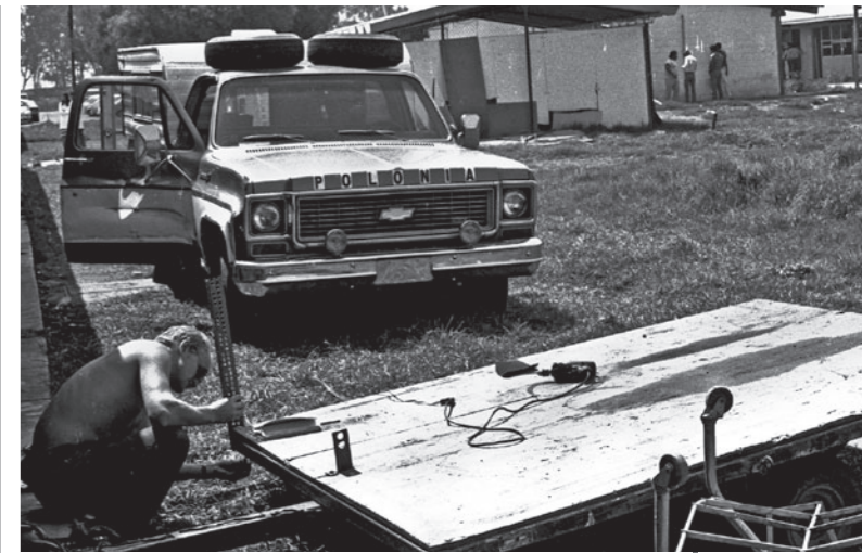
Nowy samochód potrzebował nowej przyczepy; musiała ona pomieścić większą część bagażu wyprawy