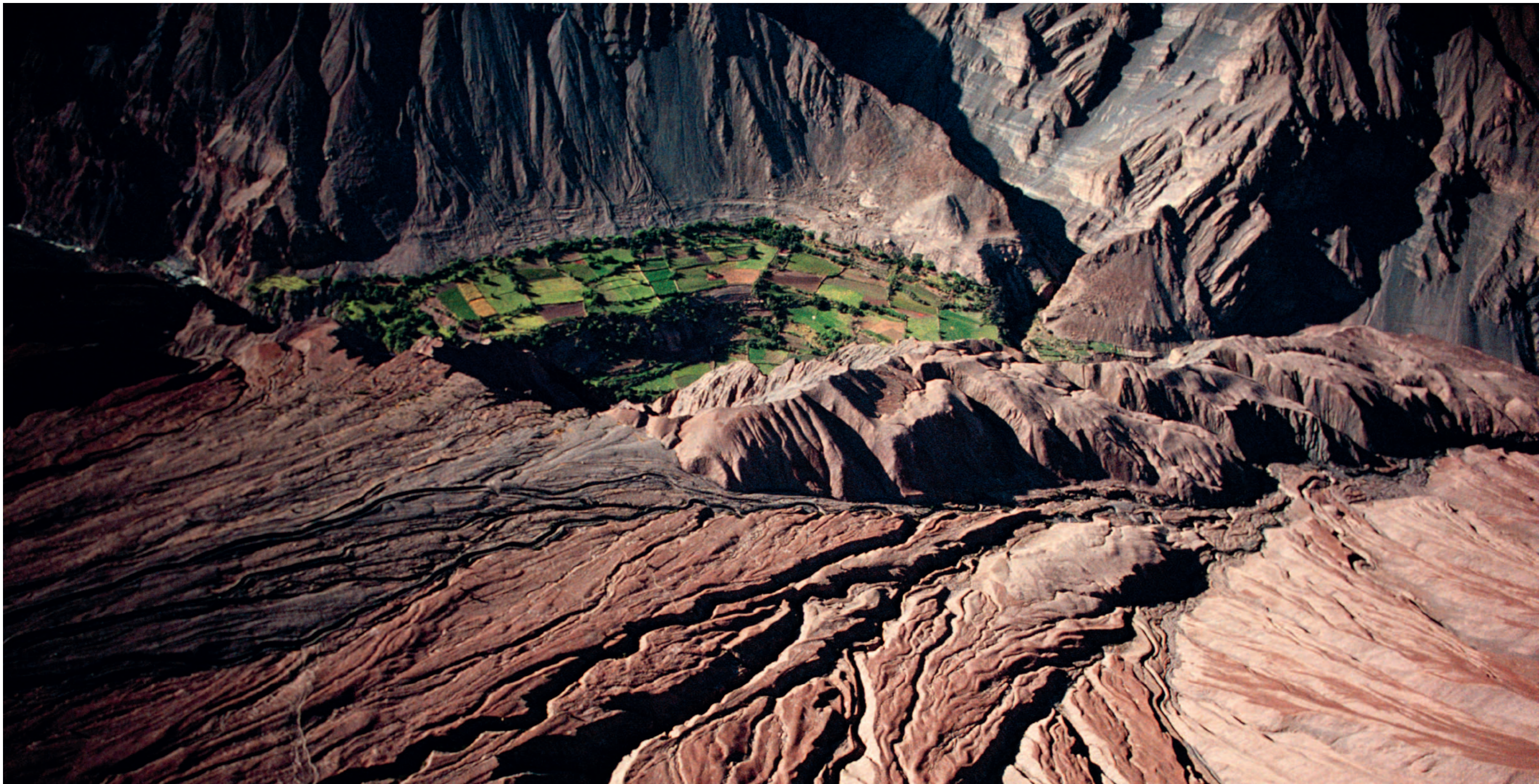
Hacienda Canco to soczewka zieleni na dnie gigantycznego, pustynnego kanionu; zdjęcie wykonane z helikoptera dziesięć lat po pierwszym splywie