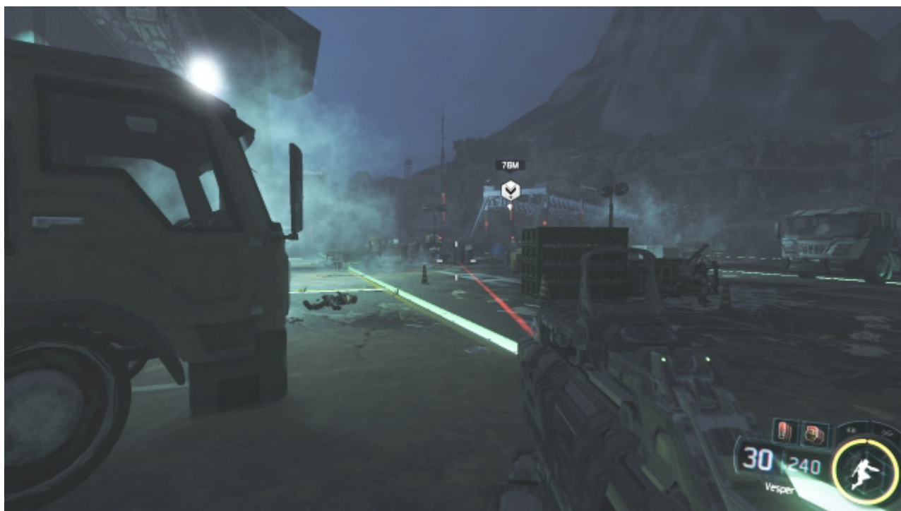
Cel: zniszczyć mosty

Gdy dojdiesz do momentu, w którym zaraz po wychyleniu się dostajesz serię z CKM-ua, schowaj się i poczekaj chwilę. Nad raketami zawieszonymi na suficie hangaru samolotu pojawi się ikona "zniszcz". Wtedy wpakuj całą serię w te rakiety, a spadną one na wrogie pojazdy.