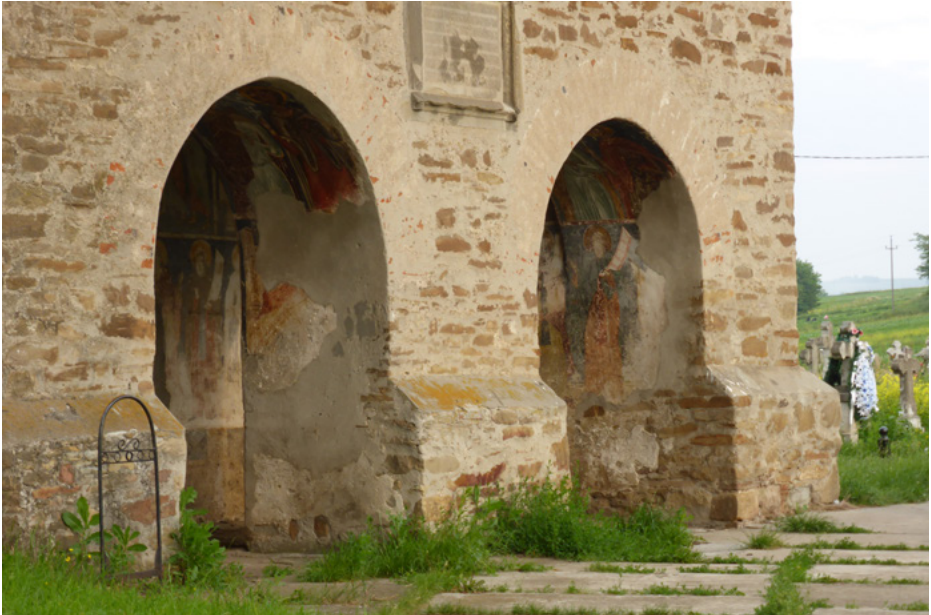
Arkadowe przejścia narteksu

W narteksie zachowały się polichromie na ścianach i sklepieniu, gotyckie portale przy wejściu do kruchty i na wieżę.