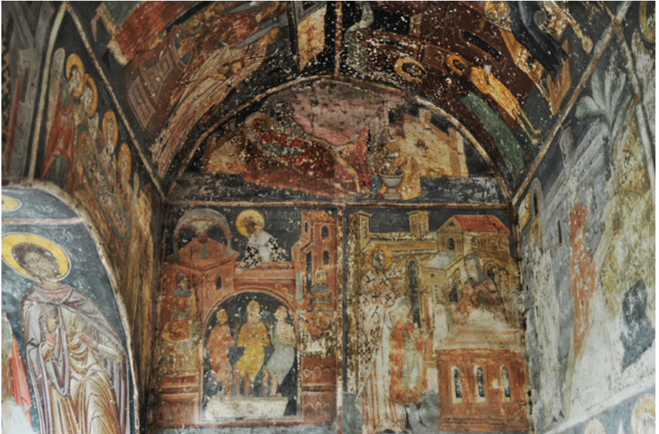
Polichromie na ścianie północnej narteksu

Wyposażenie nie zachowało się, a polichromie w najlepszym stanie są w narteksie.