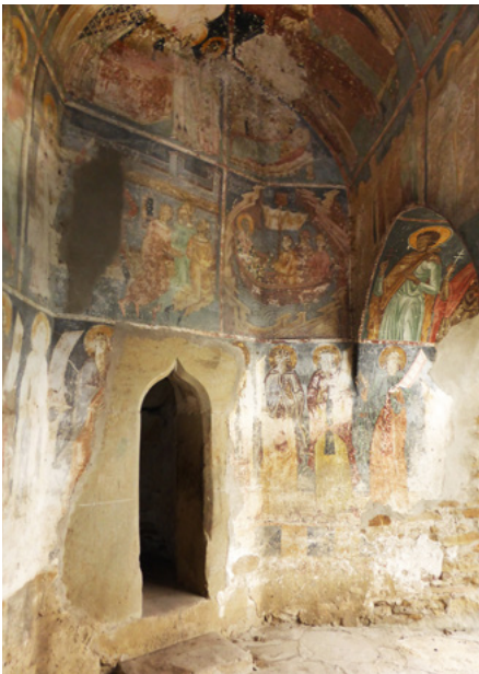
Narteks, gotycki portal (wejście na dzwonnicy)