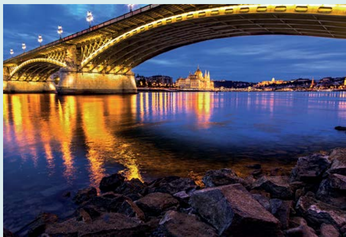
Brzeg Dunaju nocą

Wieczorny spacer wzdłuż Dunaju, po stronie Pesztu, gdzie turyści i budapeszteńscy przychodzą oglądać zachód słońca nad dzielnicą Buda, mosty nad rzeką i zamek (zob. s. 66).