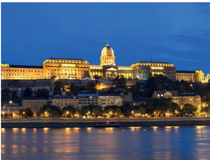
Węgierska Galeria Narodowa

studiował w Berlinie, Monachium i Paryżu. W Ostatnim dniu skazańca widać, że jego malarstwo jest realistyczne, pełne dramatyzmu, ale już w Kobiecie noszącej chrust , obrazie namalowanym w trakcie pobytu w Barbizon we Francji, widoczne jest zainteresowanie pejzażem. Drugi twórca również pozostawał pod wpływem szkoły barbizońskiej i wyrażał swój artyzm głównie poprzez malowanie krajobrazów ( Południe , Ścieżka w lesie Fontainebleau , Pejzaż z krowami ). Muzeum kolekcjonuje również monumentalne dzieła o tematyce historycznej, jak Chrzest Wajka (późniejszego króla Węgier Stefana I) autorstwa Gyuli Beneczúra oraz – na podeście schodów przy pierwszym piętrze – Miklós Zrínyi w bitwie pod Szigetvár Johanna Petera Kraffta. Przy dobrej pogodzie warto wejść na wieżę. Pod odnowioną kopułą utworzono tarasy, z których roztacza się panoramiczny widok ★★ na Budapeszt ( wejscie z trzeciego piętra muzeum ).