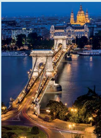
Most Łańcuchowy nocą

Spacer w dół, w kierunku mostu Łańcuchowego ★★ (zob. s. 80), by podziwiać panoramę Dunaju i widok na Peszt, a później kolacja w jednej z restauracji na nabrzeżu ★★ (zob. s. 27, 103).