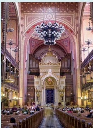
Wielka Synagoga – wnętrza

Wczesnym wieczorem spacer po dawnej dzielnicy żydowskiej Erzsébetváros ★ (zob. s. 104), uliczkami często uczęszczanymi przez miłośników imprez. Kolacja np. w jednej z modnych restauracji, a na koniec wizyta w wybranym przez siebie „barze na ruinach” ( romkert , zob. s. 36).