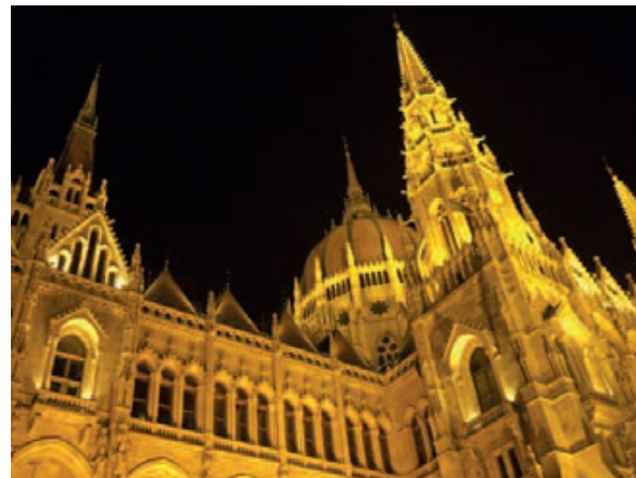
▲ Parlament nocą

Warto wspomnieć jeszcze o dwóch salach wychodzących na rzekę. Pierwsza z nich