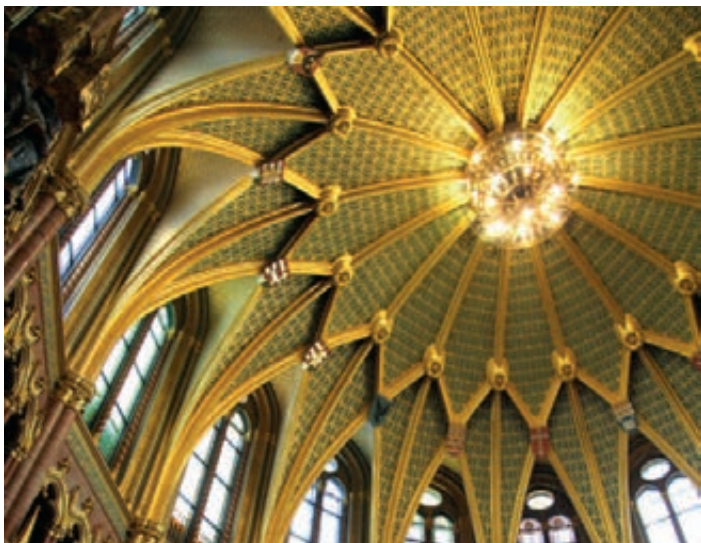
▲ Sala Kupałowa

Prace budowlane zaczęły się w 1885 r. i trwały 17 lat. Każdego dnia zatrudnionych było 1000 robotników. Jednocześnie już w 1896 r., podczas obchodów milenijnych, w budynku odbyło się pierwsze uroczyste posiedzenie parlamentu. Obiekt ma 27 bram, 29 klatek schodowych i jest zaopatrzone w 13 wind.