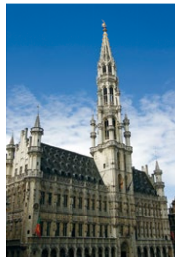
Budynek brukselskiego ratusza

Najbardziej rozpoznawalny budynek w stolicy – iglica i dziesiątki zdobniczych go posągów przyciągają wzrok tych, którzy podziwiają jego architekturę lub bezskutecznie próbują zmieścić tego kolosa w kadrze... Dwa wieki po wmurowaniu pierwszego kamienia w 1401 r. budynek w czysto gotyckim stylu składał się jedynie z obecnego lewego skrzydła i baszty. Odkąd dobudowano skrzydło prawe (krótsze), brama ratuszowa nie jest idealnie wpasowana w oś budynku. Nie wynika to jednak