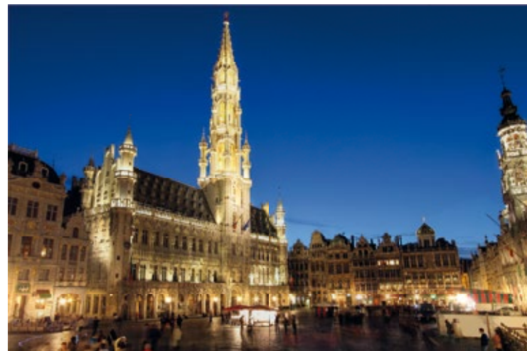
Życie nocne na Grand-Place

Miejsce, które Flamandzcy wciąż nazywają „dużym rynkiem” (Grote Markt), jest dziś gigantyczną „miejską sceną”, na której można oglądać śluby oraz częste