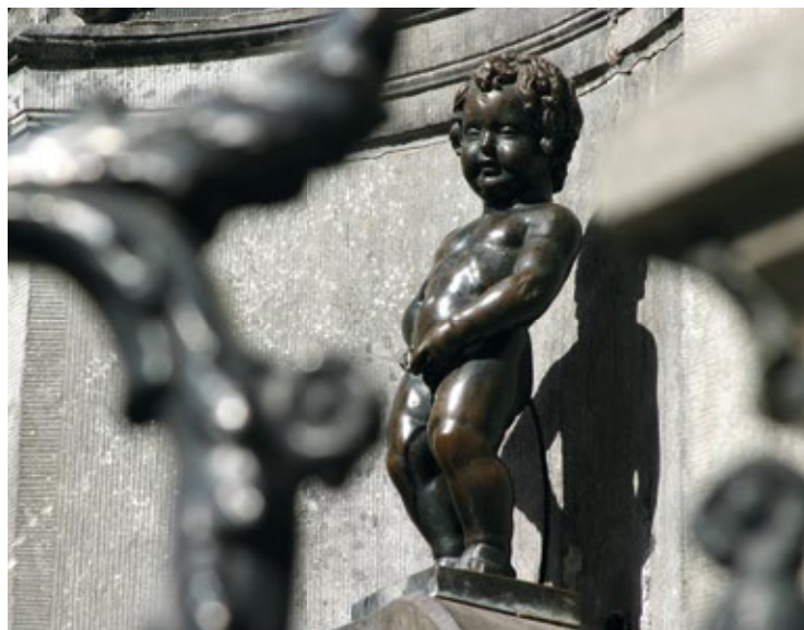
Manneken Pis – najsłynniejszy obywatel miasta

Czy wiedzieliście, że Manneken Pis nie jest jedyną postacią, która załatwia się w Brukseli w miejscu publicznym? Jego żeński odpowiednik, Jeanneke Pis, kuca tuż obok ulicy rue des Bouchers. Ostatnio rodzina powiększyła się o Zinneken Pis. Warto zobaczyć tego psa podnoszącego łapę na rogu ulic rue des Chartreux i rue du Vieux-Marché-aux-Grains.