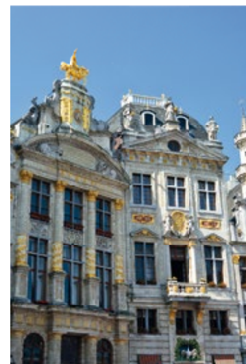
Zabytkowe kamienice przy Grand-Place

28 – Kamienica zwana Pokoikiem Ammana – magistratura księcia brabanckiego.