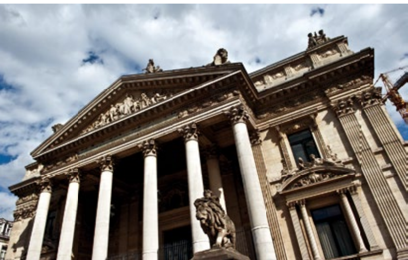
Monumentalny budynek Giełdy