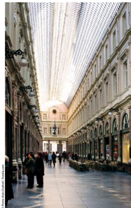
W Galerii Królowej znajdziemy luksusowe sklepy

W lipcu 1873 r. Paul Verlaine przybył do Brukseli i pisał do Arthura Rimbauda o swoim zamiarze zaciągnięcia się do armii hiszpańskiej. Na tę wiadomość autor Statku pijanego przybył do przyjaciela. Dwaj poeci kłócili się nieustannie, włócząc się od jednej knajpki do drugiej. Verlaine, który groził, że popełni samobójstwo, kupił rewolwer w sklepie z bronią w pasażu św. Huberta. Pod nr. 1 przy rue des Brasseurs strzelił dwa razy do Rimbauda, raniąc go w nadgarstek. Ten doniósł na przyjaciela na policję i wrócił do Paryża. Verlaine został aresztowany, uwięziony w Petits-Carmes, osądzony i skazany na dwa lata więzienia.