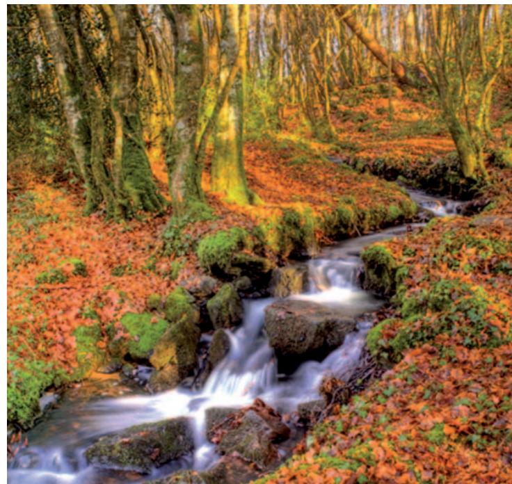
Tajemnicza atmosfera lasu Brocéliande stała się inspiracją dla powstania wielu legend

To właśnie w tym mitycznym lesie można znaleźć miejsca związane z ważnymi postaciami cyklu legend arturiańskich. Najsłynniejszą z nich jest czarnoksiężnik Merlin, którego grób znajduje się niedaleko Źródła Wiecznej Młodości. Podania nie określają, gdzie znajduje się skała, z której Artur wyciągnął miecz Ekskalibur, ani gdzie stał Okrągły Stół dla 365 rycerzy króla, ale same imiona Lancelota czy Wiwiany wystarczą, by mieć wrażenie, że wstąpiło się do krainy legend.