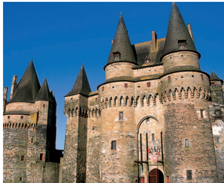
Baszty zamku w Vitré

Maison de la Roche-aux-Fées – Essé – tel.: 02 23 31 03 13 – VII–VIII: 11.00–18.00; V, VI i IX: sb.–nd. i święta 11.00–18.00. W pobliżu grobowca znajduje się centrum informacji turystycznej organizujące ciekawe wystawy i imprezy.