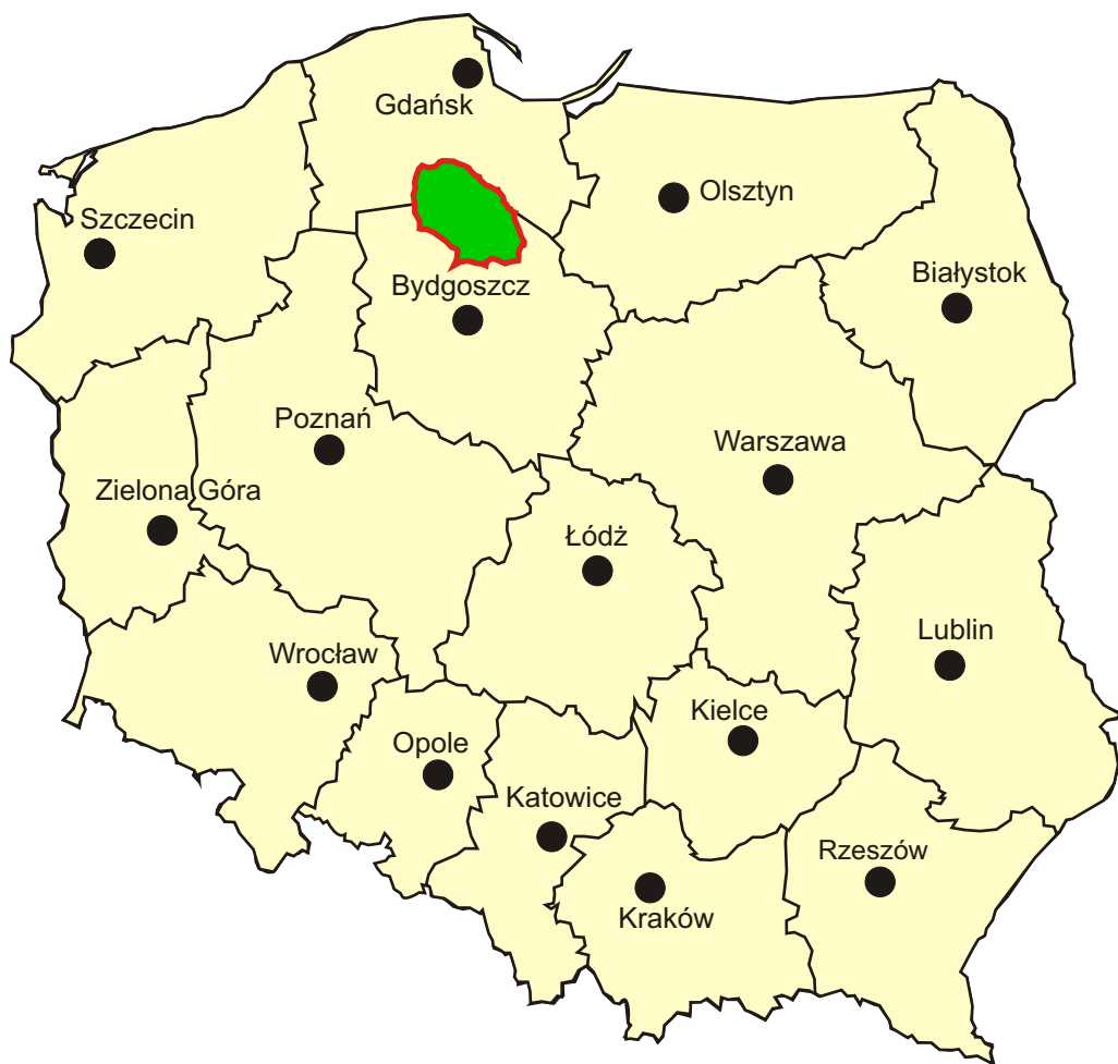
Położenie Borów Tucholskich na schematycznej mapie Polski