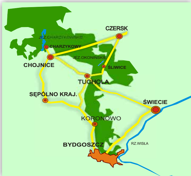
Główne trasy samochodowe prowadzące z Bydgoszczy

Wszystkie większe ośrodki i obiekty turystyczne takie jak np. Osiek, Tleń, Tuchola, Swornegacie, Sokole Kuźnica, Charzykowy posiadają autobusowe połączenia. Kilka razy dziennie kursują do nich autobusy.