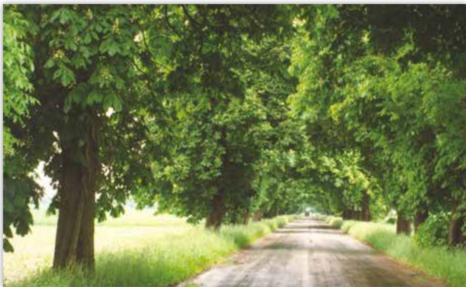
Droga dojazdowa do Borów Tucholskich z Pruszczą do Tlenia

Bory Tucholskie są to unikalne tereny na Niżu Północnoeuropejskim. W stanie naturalnym krajobrazu młodogłacjalnego. Spełniają międzynarodowe kryteria rezerwatu biosfery.