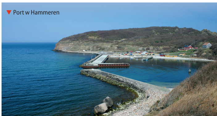
▼ Port w Hammeren

Znacznie większym akwenem jest ★ Hammersøen powstałe po wycofaniu się stąd lodowca. To największe jezioro Bornholmu (10 ha). Jego względnie duża głębokość (13 m) i położenie blisko morza skusiły Piotra Wielkiego do powzięcia planów zamienienia zbiornika w główny basen portowy przyszłej bazy morskiej. W czasie wizyty na Bornholmie w 1716 r. car dyskutował