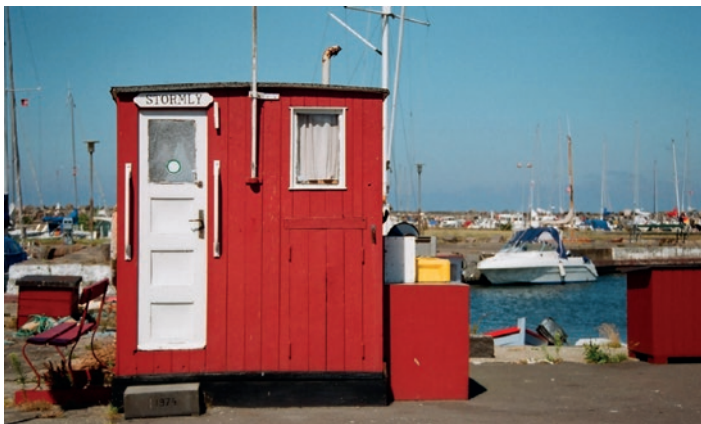
▲ Budka sztormowa w porcie w Rønne