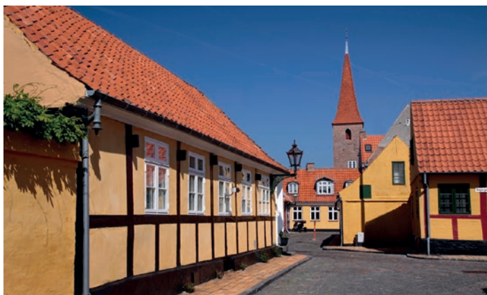
▲ Uliczka w Rønne