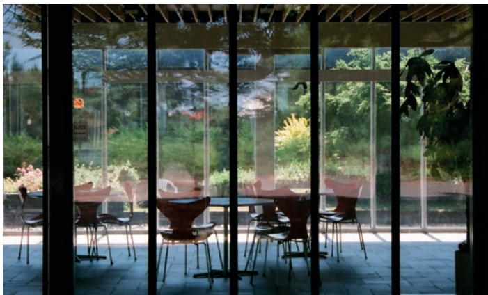
▲ Biblioteka w Rønne

warta oględzin. Zbiory rozmieszczono w 20 ponumerowanych salach na parterze (1–7), w salach bocznych (8–12), na piętrze (13–17) i na poddaszu (18–20).