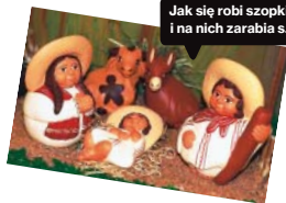
Jak się robi szopki na świecie i na nich zarabia s.61