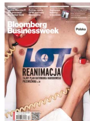
Numer z sierpnia 2012

A możliwości są dwie: LOT nie zapłaci Boeingowi dwóch zaliczek na poczet nowych dreamlinerów lub Amerykanie znajdą sposób na przejęcie tegorocznych zobowiązań wynikających z leasingu finansowego na te maszyny. s.30