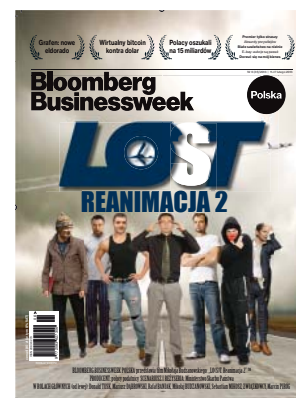
Numer z lutego 2013