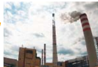
Telekomy nauczą energetyków dbać o klienta 10