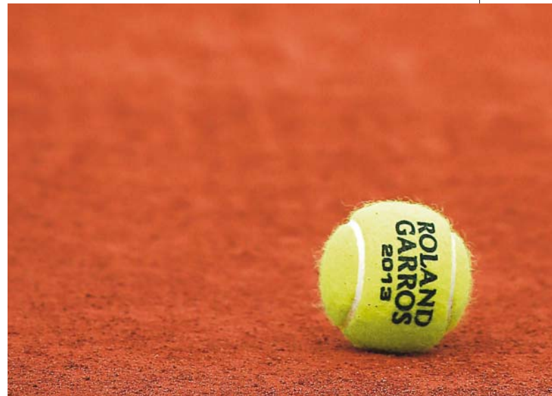
Jak Paryż zarabia na tenisie s.50

Obligacje Orlenu jak ciepłe bułeczki s.48