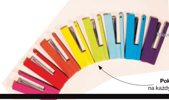
Pokaz mody na każdym biurku s.63