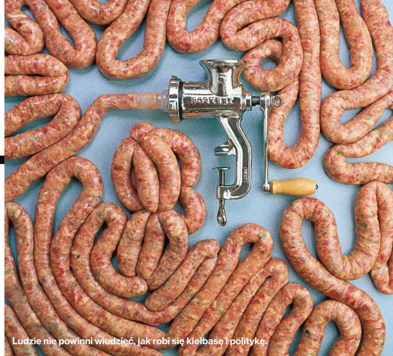
Ludzie nie powinni wiedzieć, jak robi się kiełbasę i politykę.

Prognoza Relugi: powolne wychodzenie z dolka s.44