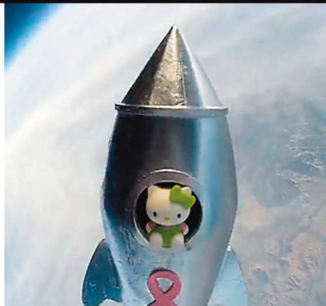
Japońska kotka na razie nie ma konkurencji s.48