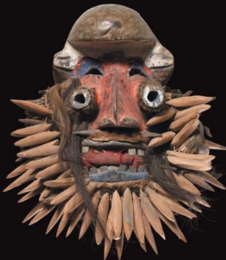
1895 rok Pierwotny hipster