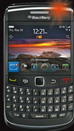
2010 rok Przypinane do paska narzędzie do przekazywania wiadomości Kanada