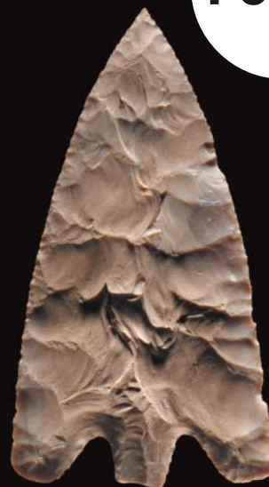
2000 rok p.n.e. Przełęczająca broń Ameryka