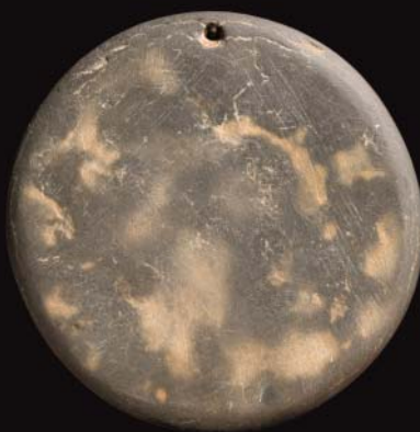
3600 rok p.n.e. Dysk w kształcie słońca