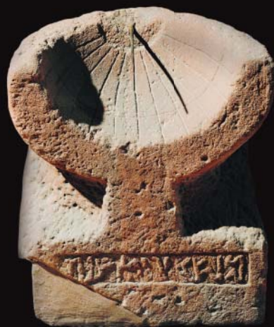
600 rok p.n.e. Stoper Asyria