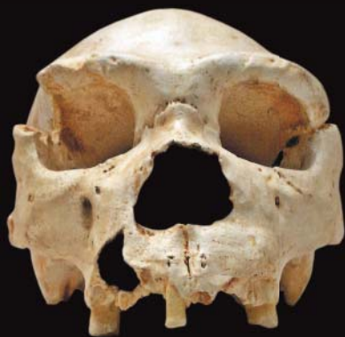
350 000 rok p.n.e. Zmarły kuzyn Eurazja