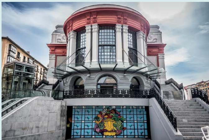
Mercado de la Ribera

Zwiedzanie miasta w niecodzienny sposób: na pokładzie statku lub, bardziej oryginalnie, w kajaku – dzięki czemu zobaczymy miasto z innej perspektywy i łatwiej dostrzeżemy zmiany, jakie tu zaszły od lat 80. XX w. Bilbao można zwiedzać również rowerem, z rozwianymi włosami, podążając tematyczną ścieżką, która dostarczy nam wielu ciekawych informacji o mieście. Zob. s. 19, 22.