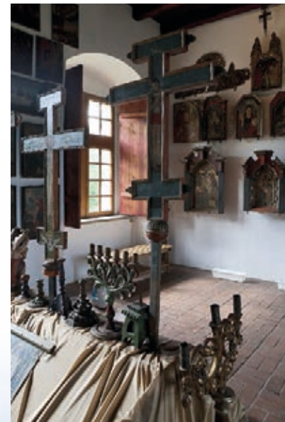
▲ Część zamkowej ekspozycji ikon

pierwotnie m.in. w Sanoku, Brzozowie, Birczy, Jaśliskach, Dębowcu, Niebylcu i Ustrzykach Dolnych.