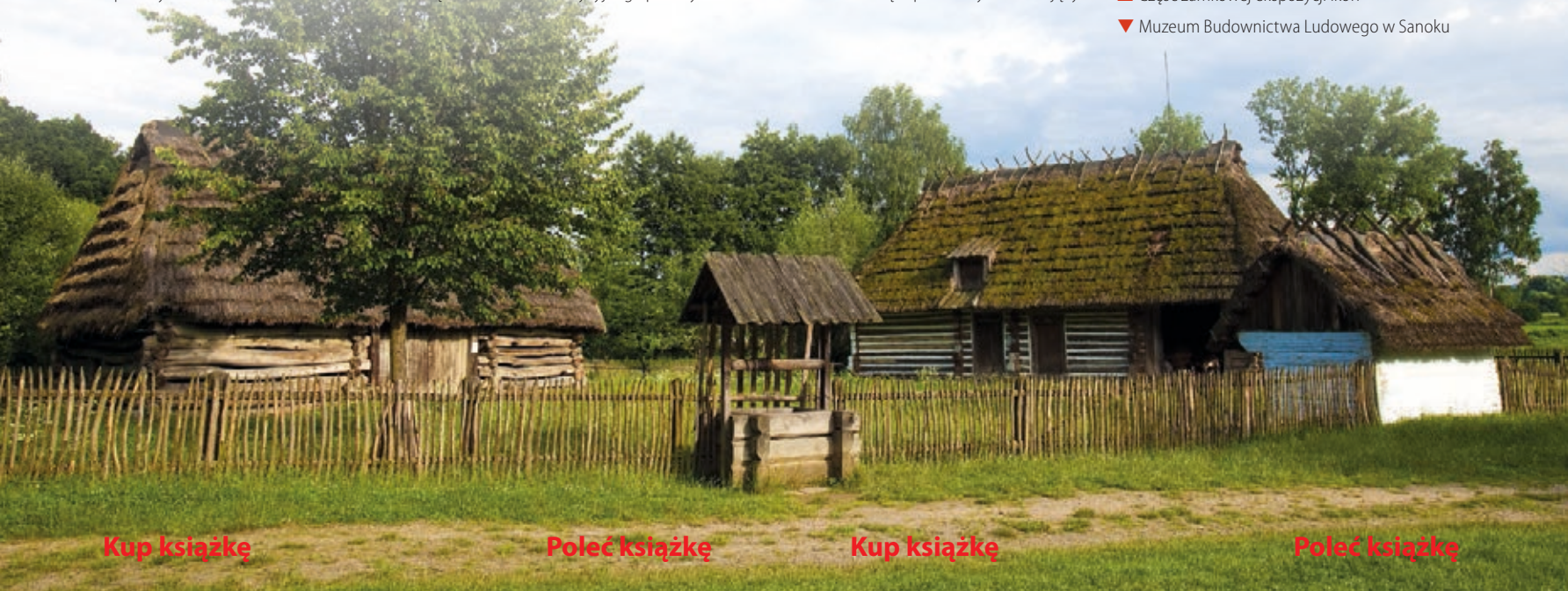
▼ Muzeum Budownictwa Ludowego w Sanoku