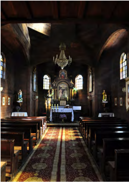
Nawa i prezbiterium