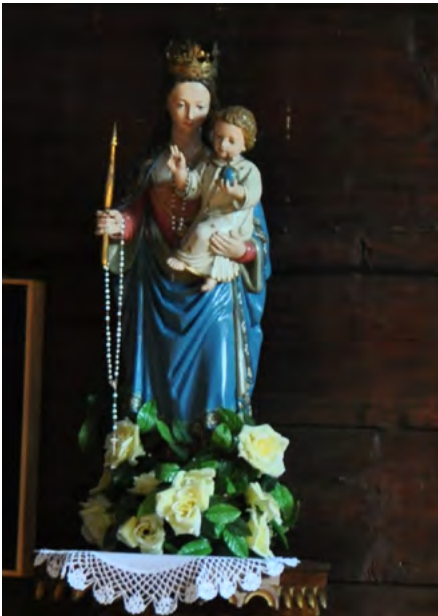
Rzeźba Matki Boskiej z Dzieciątkiem, w nawie

W ołtarzu są obrazy św. Zofii z córkami, Jezusa Miłosiernego i ikona św. Mikołaja.