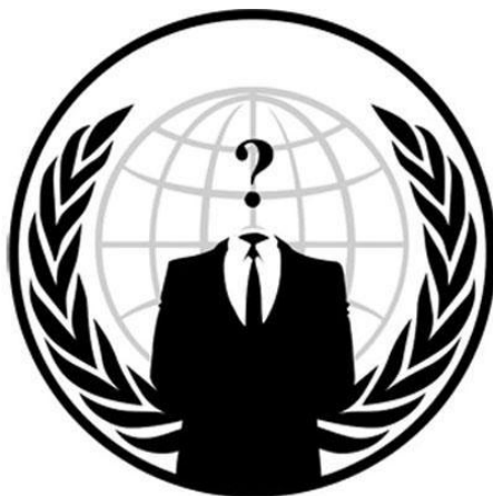
Rysunek 3-2 Logo Anonymous

Anonymous to najbardziej rozpoznawane ugrupowanie skupiające ludzi sprzeciwiających się cenzurze, korupcji czy wpływowi kościoła katolickiego. Mają wiedzę i umiejętności pozwalające im nazywać się Hackerami, jednak mają bardziej ugruntowany cel społeczno – polityczny.