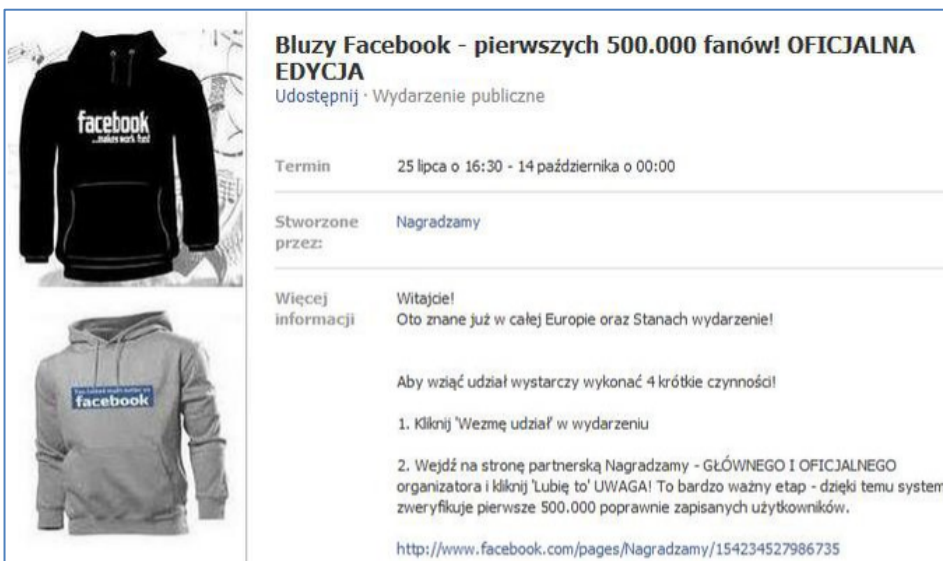
Rysunek 3-3 Falszywy konkurs

Częstym działaniem jest podszywanie się pod znane i cenione firmy, witryny, organizując ankiety lub konkursy z atrakcyjnymi nagrodami, gdzie pytania są proste, oczywiście nagroda jest cenna i gwarantowana. Niestety, ale w taki sposób po prostu sami udostępniamy swoje dane adresowe i osobowe, a żadnej nagrody nie otrzymamy. Metoda taka to tak zwany scam .