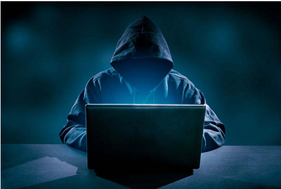
Rysunek 3-1 Symboliczny obraz Hackera

Hacker to osoba, która wyszukuje i wykorzystuje dziury w oprogramowaniu, by następnie je wykorzystać na swoją korzyść. Hackera możemy porównać do włamywacza, który sforsuje zamek i dostanie się do środka chronionego obiektu. W przypadku sieci, dostanie się do chronionego systemu informatycznego przeglądając i wykradając poufne dane w celu ich sprzedaży lub szantażu. Hackerzy stosują różnego rodzaju metody socjotechniczne, spam i fałszywe witryny w swoich działaniach.