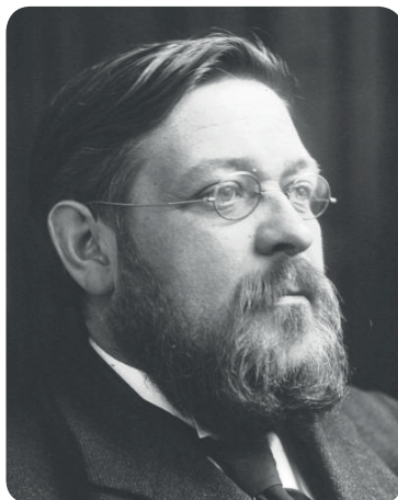
Rys. 2. Albert Thomas

Pierwszym Dyrektorem MOP był Francuz Albert Thomas (Rys. 2.), który pełnił tę funkcję przez 12 lat, aż do swojej śmierci. Z wykształcenia historyk, z zawodu polityk i dyplomata, podróżował po krajach Europy, obu Ameryk oraz Azji, gdzie starał się promować cele i działania MOP.