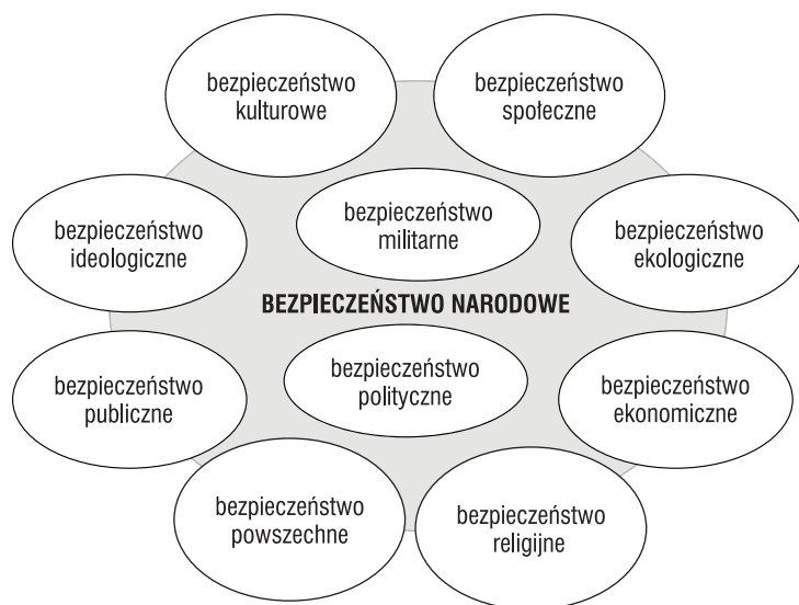
Rysunek 3. Relacje między różnymi rodzajami bezpieczeństwa a bezpieczeństwem narodowym