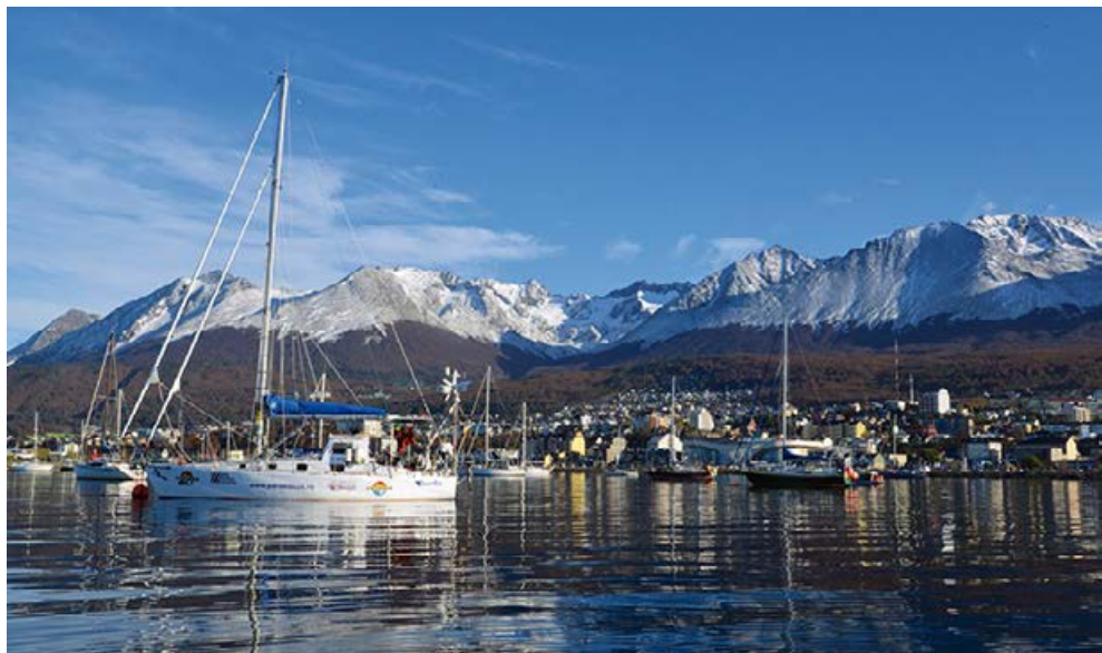
„Phoenix” w Ushuaia, najbardziej na południe wysuniętym porcie Argentyny.

do kwestii polowań na zbiegłych niewolników – Darwin był świadkiem jednej z takich akcji w brazylijskiej dżungli i zgorzony opowiedział o tym kapitanowi. FitzRoy nie widział w tym niczego zdrożnego, a ponieważ był znany z porywczego charakteru (podwładni nadali mu przydomek „Gorąca Kawa”), skończyło się ostrym konfliktem. Chwały w oczach kapitana nie przyniosły Darwinowi również jego zmagania z chorobą morską – chłopak w drodze z Anglii był nią tak wymęczony, że rozważał nawet zejście z żaglowca po dopłynięciu do brzegów Ameryki Południowej i przemieszczanie się transportem lądowym.