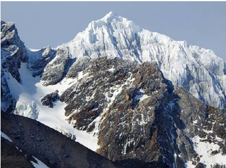
Jedna z gór pasma Cordillera Darwin.

Obecnie nie sposób ustalić, kto nadał te wszystkie nazwy, ale w przypadku góry wiadomo, że była to inicjatywa samego FitzRoya, który w ten sposób załatwił kwestię prezentu urodzinowego dla kończącego 25 lat naukowca. Zanim jednak do tego doszło, panowie specjalnie za sobą nie przepadali. Mimo że byli w podobnym wieku (FitzRoy był tylko cztery lata starszy od Darwina), różnili się podejściem do wielu spraw, na przykład