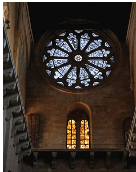
▲ Rozeta katedry w Ruvo di Puglia

W fasadzie tej pięknej świątyni na uwagę zasługuje bogato zdobiony portal, a tak-