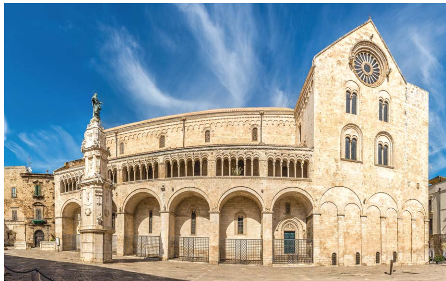
▲ Katedra Wniebowzięcia NMP

Jeśli tuż za kościołem Czyścowskim skręcimy w prawo w Corte Vescovado i przejdziemy przez bramę znajdującą się na końcu tego zaułka, dotrzemy na szeroki dziedziniec otoczony z trzech stron przez