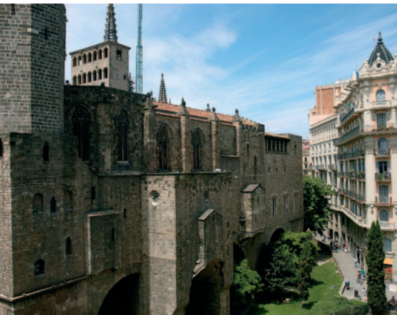
Zabytkowa architektura Barri Gòtic

We wschodnim ramieniu transeptu, nad bramą Sant Iu, mieszczą się monumentalne organy.