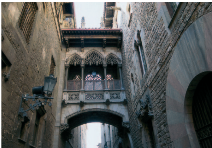
Neogotycka galeria przy ulicy del Bisbe Irurita

Z tyłu Pałacu Biskupiego usytuowany jest niewielki Plaza de Garriga i Bachs , z którego rozciąga się znakomity widok na przeciwległą bramę Santa Eulflia, prowadzącą do wrydarza katedry. Rzeźba zdobiąca jeden z jej boków, będąca hołdem dla mieszkańców