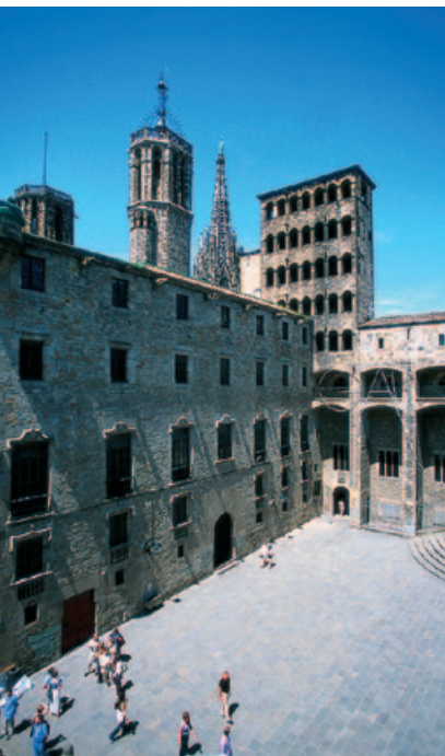
J. Malabarret / AIC/REI/EN

Brama główna usytuowana od strony ulicy dels Comtes prowadzi prosto do zachwycającego dziedzińca w stylu włoskim otoczonego na parterze wysokim arkadowym krużgankiem. Na piętrze znajduje się przestronna galeria z kolumnami w stylu tokańskim, na którą wiodą eleganckie schody.