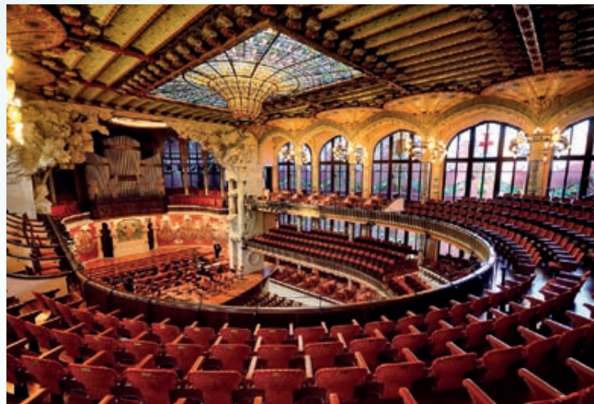
Palau de la Música Catalana Wpisany na Listę UNESCO Pałau de la Música Catalana.