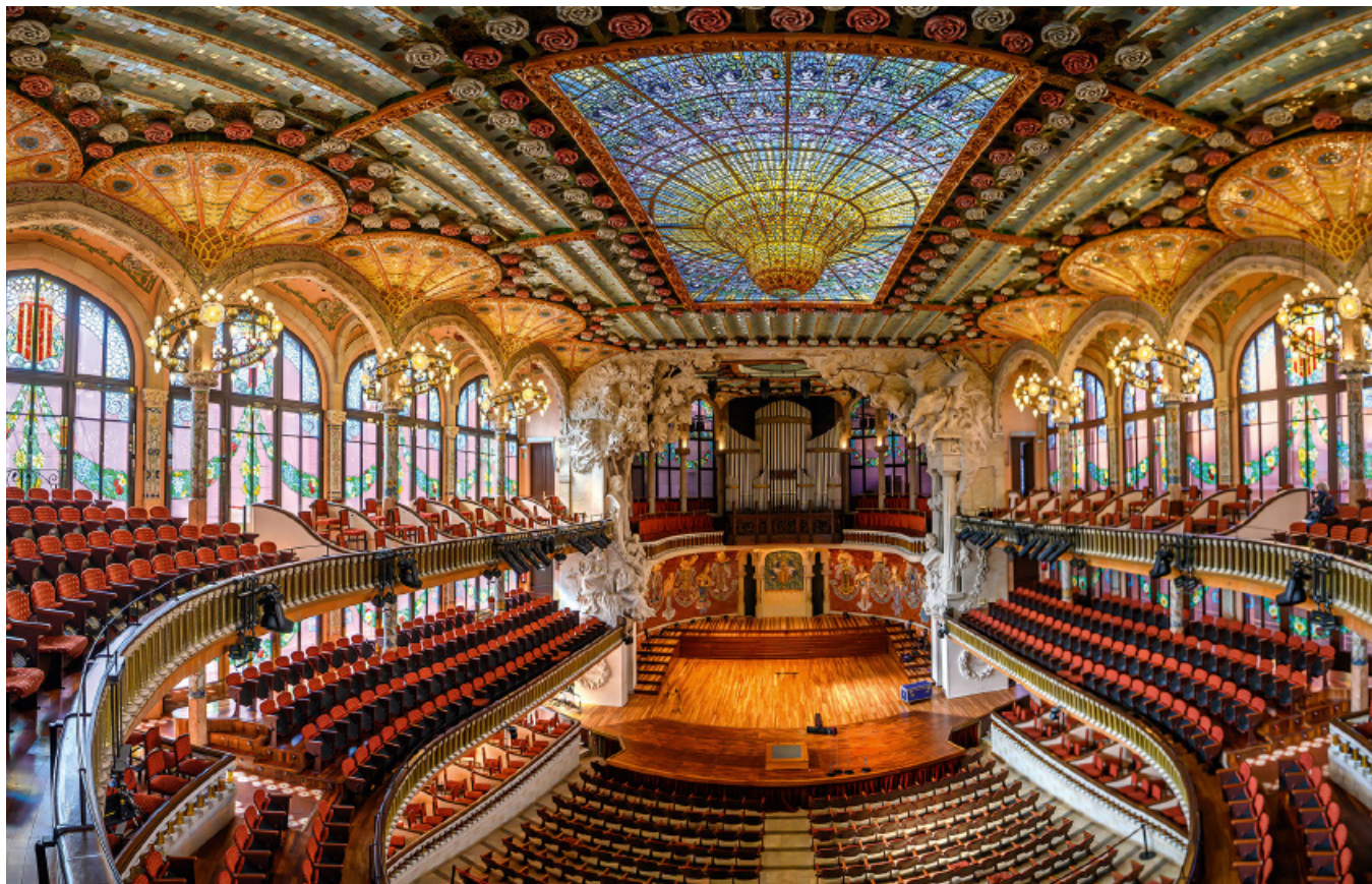
▲ Pałac de la Música Catalana

Najlepiej zachowaną średniowieczną ulicą Barcelony i sercem dzielnicy jest Carrer de Montcada, której gotyckie pałace-rezydencje wplywowych wówczas