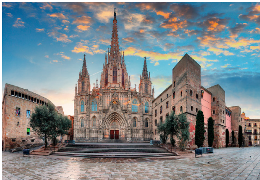
▲ Gotycka Katedra Barcelony

Wnętrze świątyni w dominującym stylu katalońskiego gotyku tworzą: try jednakowej wysokości nawy z najszerszą nawą główną, prezbiterium z chórem kapłańskim i głównym ołtarzem oraz 28 kaplic w bocznych nawach i za ołtarzem. Cienkie kolumny, ostre łuki, okna