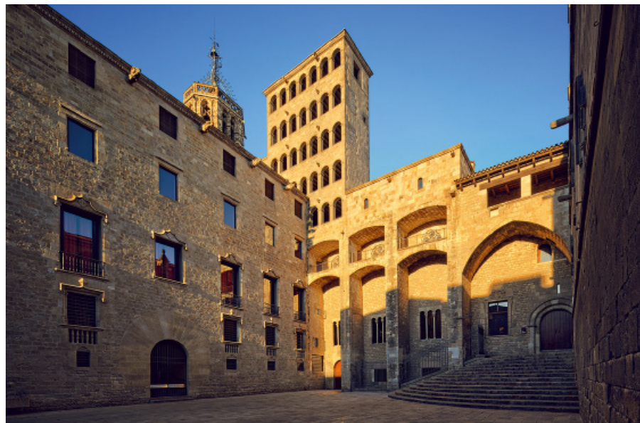
▲ Kompleks dawnego Pałacu Królewskiego

Wizyta w podziemiach to spacer ulicami rzymskiego miasta, z pozostałościami łaźni, kanalizacji, farbiarnią i pralnią z II w., solarnią ryb z III w., wytwórnią garum, przechowalnią wina, która mogła