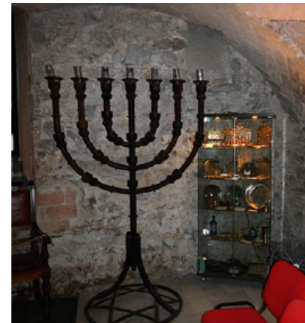
▲ Centrum interpretacyjne dzielnicy żydowskiej

Na krańcu dzielnicy gotyckiej blisko wybrzeża przy Plaża de la Mercè wznosi się Església de la Mercè – barokowa bazylika poświęcona patronce miasta Matce Boskiej Łaskawej. Ku jej czci 22-24 września odbywa się jedno z największych w Barcelonie świąt – z ogniami sztucznymi, paradami gigantów i castells (wieże z ludzi stojących jeden na drugim). Kościół na planie krzyża łacińskiego wyróżnia kopuła nad prezbiterium z wielką figurą Maryi, widoczną z daleka. Pełne przepychu wnętrza zdobią złoczone ołtarze, mozaiki i freski oraz otoczony czcią wizerunek Matki Boskiej Łaskawej.