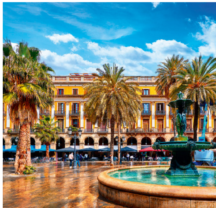
▲ Plac Reial w historycznej części miasta