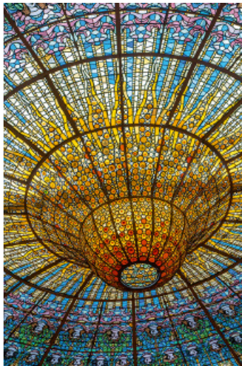
▲ Witrażowy świetlik w Palau de la Música Catalana