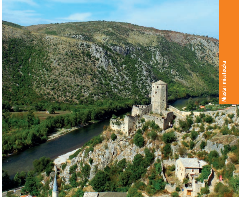
Počitelj, twierdza górująca nad miasteczkiem i doliną Neretwy