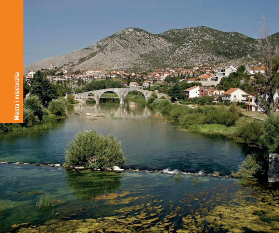
XVI-wieczny most Arslanagicia niedaleko Trebinje