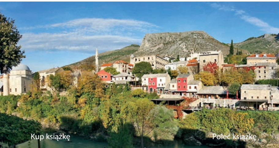
Stare miasto w Mostarze, głównym ośrodku miejskim Hercegowiny