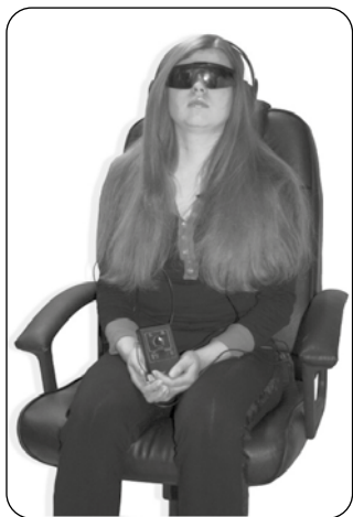
Autohipnoza nagrań MP3 na relaks i odprężenie

Autohipnoza to bezpieczna metoda dla każdego, chcącego zgłębić tajemnice własnego umysłu, nieświadomości, wewnętrznego Boskiego „Ja” i zewnętrznych przejawów transcendentnej rzeczywistości. Dzięki medytacji w autohipnozie możemy poznać swoją osobowość i jej wszystkie strony dobre i złe. Również zetknąć się z naturą wszechświata, z korzyścią na rozwój duchowy oraz uzdrowienie ciała i duszy. Jak również uzyskać korzystne odczucia wyciszenia, cierpliwości wobec siebie i innych. Ten stan doprowadza do spojrzenia na świat materialny z innego, wyższego poziomu świadomości. To wszystko można uzyskać i doświadczyć w pracy z samym sobą. Ażeby jednak uzyskać pełniejszy stan autohipnozy na drodze rozwoju duchowego i podróży astralnych, polecam indywidualne seanse hipnotyczne.