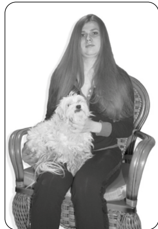
Wspólna autohipnoza z przyjacielem

Świadomość jest kapitanem, to ona myśli i działa, a reszta organizmu jest statkiem, na którego rzecz pracują nasze myśli, czyli załoga, i wykonują polecenia kapitana umysłu. Oto prosta i zrozumiała ilustracja. W autohipnozie używamy modyfikacji, które polegają na zagłębieniu się w myślach i rozmyślaniu podobnie jak modlitwa. Z tym że w autohipnozie tworzy-