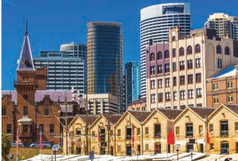
Campbell's Storehouses