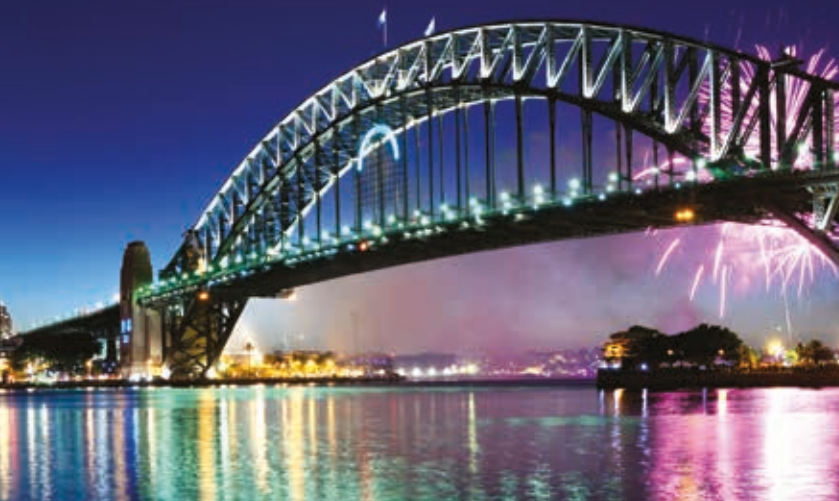
Sydney Harbour Bridge

w mieście: w Haymarket (róg Dixon St. i Goulburn St. - 11.00–17.00), Kings Cross (róg Darlinghurst Rd i Springfield Av. - 9.00–17.00), Circular Quay (róg Pitt St. i Alfred St. - 9.00–17.00) i Manly (Manly Warf - ☎ [02] 9976 1430 - www.hello-manly.com.au - 9.00–17.00).