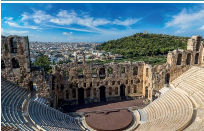
Odeon Heroda Attyka

Fryz zdobiący proscenium, wykonany za panowania Nerona (I w. n.e.), przedstawia mit o Dionizosie. Chór stał wokół ołtarza ku czci Dionizosa, na marmurowych płytach tworzących wzór rombu. W pierwszym rzędzie, tuż nad siedzeniami