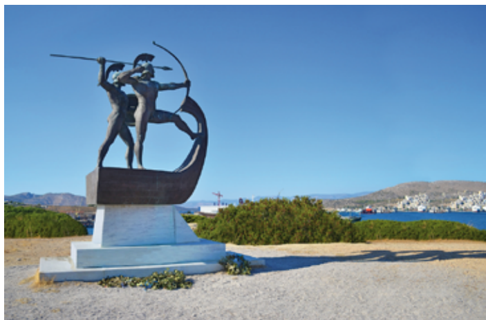
▲ Pomnik obrońców Salamin

Bujne zielone lasy, urokliwe wioski, dziewicze plaże oblane krystalicznie czystymi wodami – Egina może poszczycić się różnicowanym i pięknym krajobrazem.