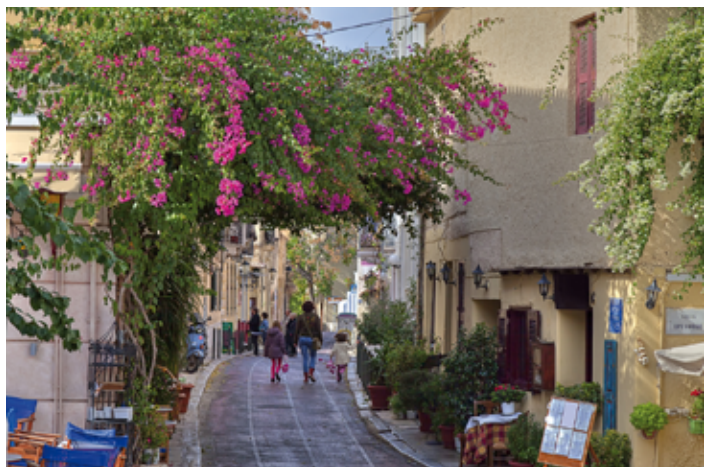
▲ Uliczka w dzielnicy Plaka

Rola Aten zaczęła powoli maleć wraz z nastaniem epoki bizantyjskiej. Filozofia neoplatonicka została zastąpiona