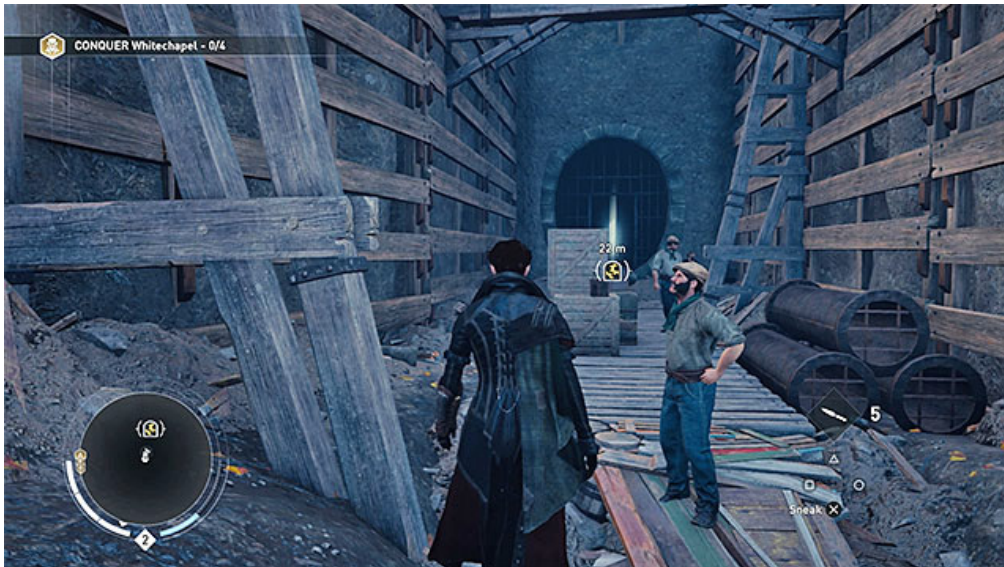
Wejście do kanałów

Celem podróży jest duży plac budowy w dzielnicy Londyńskie City. Po dotarciu do obszaru wskazywanego przez znacznik przedostań się na najniższy poziom i zlokalizuj niewielkie wejście prowadzące do kanałów.