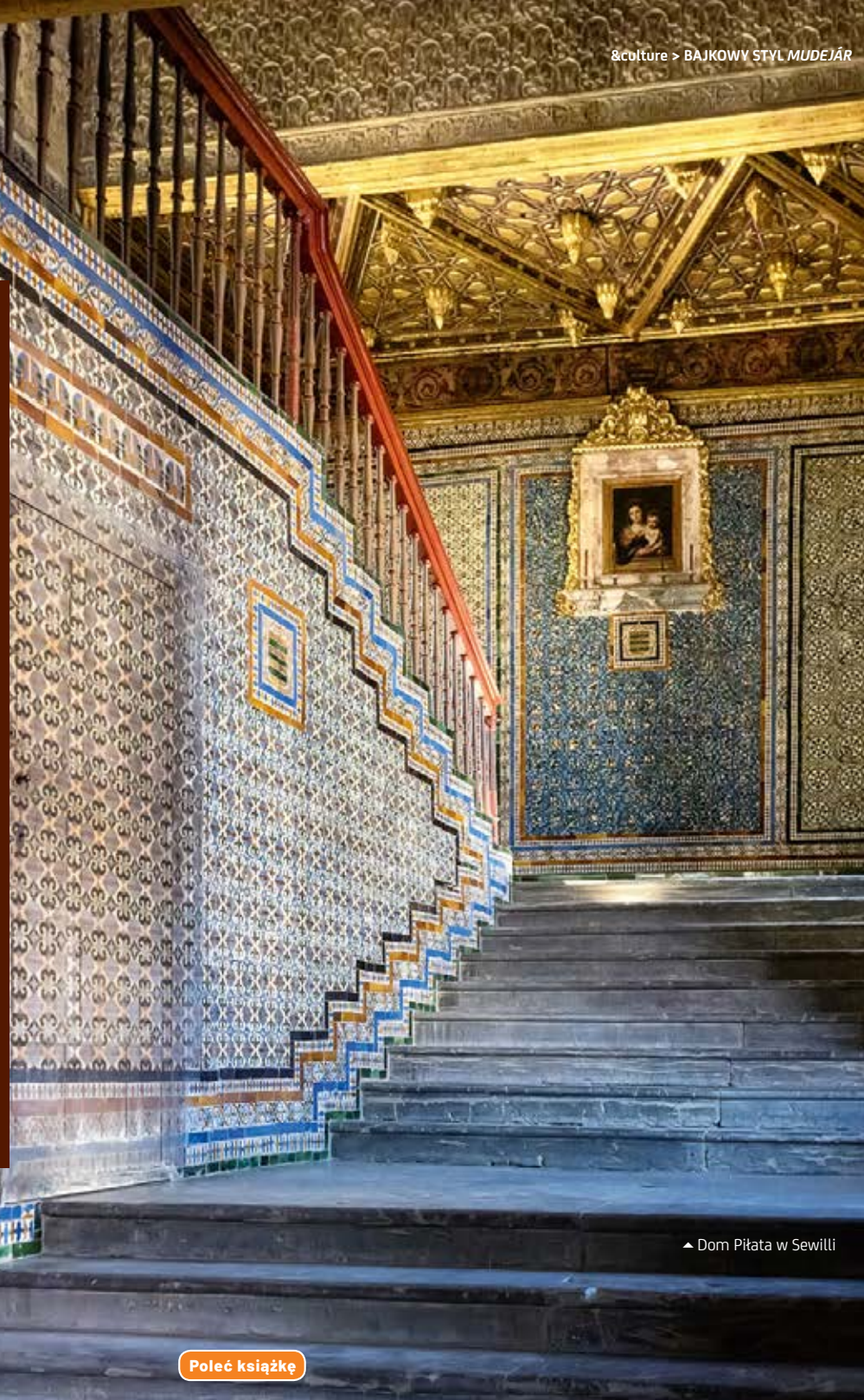
▲ Dom Piłata w Sewilli

Innymi przykładami stylu mudéjar w Andaluzji są Dom Piłata w Sewilli, Kaplica Królewska oraz św. Bartłomieja w kordobańskiej katedrze, a także liczne kościoły w całym regionie. Bogactwo stylu mudéjar najczęściej można podziwiać, patrząc na ozdobne stropy i dzwonnice.