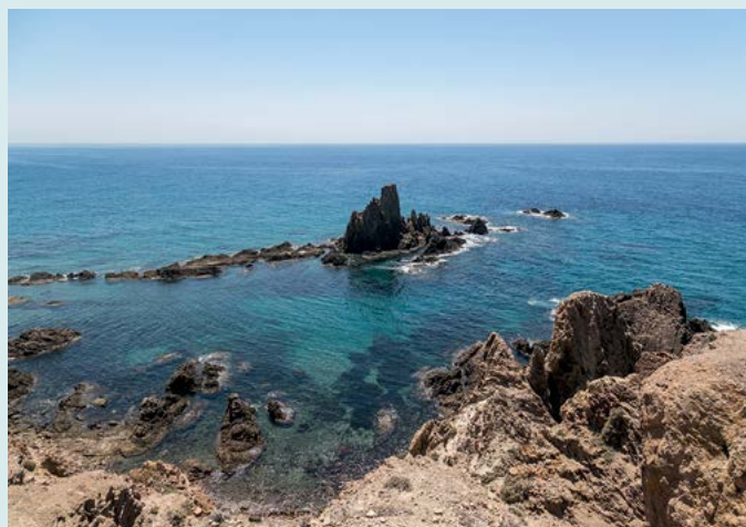
Parque Natural de Cabo de Gata

Modna i droga mekka windsurferów i kitesurferów (zob. s. 94).