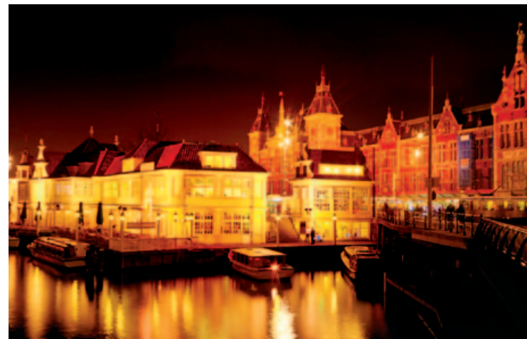
Nocna panorama centrum

Zob. Amsterdams Historish Museum (s. 84) i Engelse Kerk w Begijnhof (s. 85).