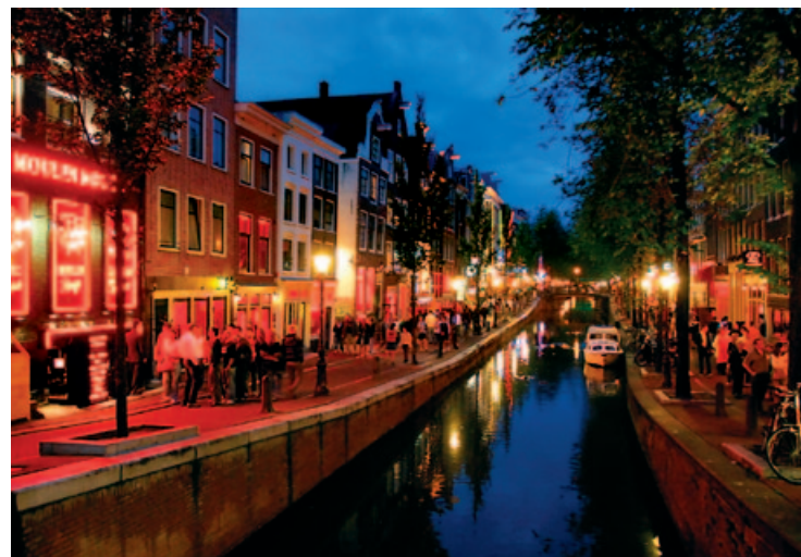
Dzielnica Czerwonych Latarni

Za tym pełnym domysłów przydomkiem kryje się „stara strona” (Oude Zijde) historycznego centrum. Część ta, położona na wschód od osi Damrak-Rokin, została w XV w. wyróżniona od omawianej w poprzednim rozdziale „nowej strony” w wyniku podziałów parafialnych. Okolice zwane są również Walletjes („małe murki”) z powodu wąskich, starych uliczek, na których znajdują się witryny z prostytutkami. Ogromne zainteresowanie tą dzielnicą wynika ze zdumiewającej mieszanki zabytków historycznych, uroczych kanałów, atelier kreatorów mody, sex-shopów i czerwonych neonów.