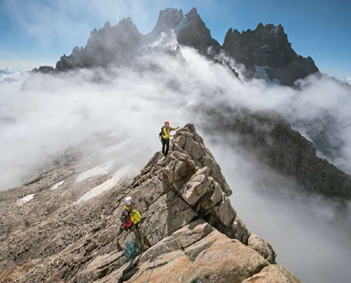
🚩 NA POŁUDNIOWEJ GRANI PIC NORD DES CAVALES, W TLE GRANDE RUINE.

du Clot des Cavales, stanowiącej przejście do schroniska Refuge Châtelleret w dolinie Vallon des Étançons. Droga gubi się poniżej wschodniej ściany Pic Nord des Cavales w rumoszu skalnym i płatach starego śniegu lub szczątkach lodowca. Naszym celem jest teraz szczybka bezpośrednio na południe od góry, oznaczona na mapie kotą 3168 m.