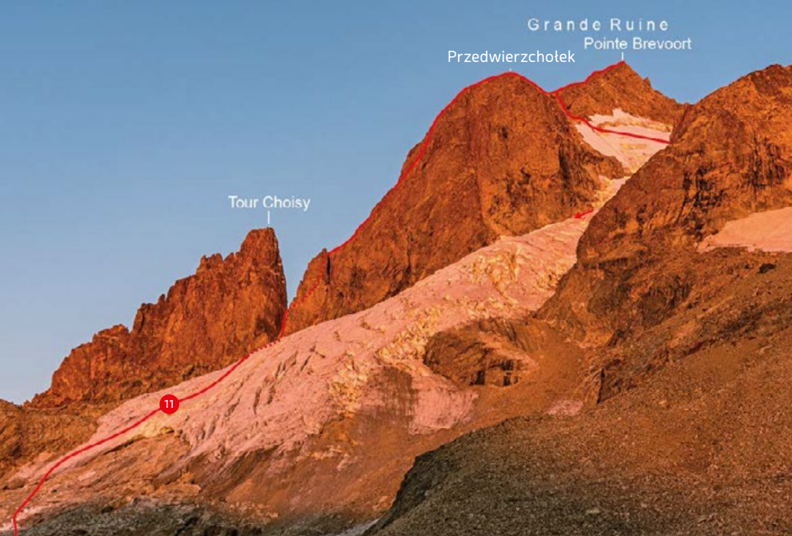
♣ ZACHÓD SŁOŃCA W OKOLICY GRANDE RUINE.